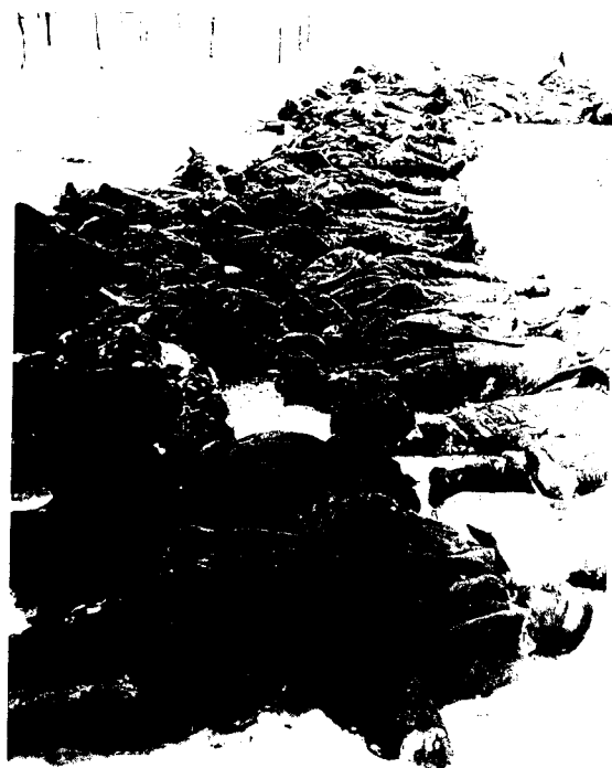
Из документов выставки: советские военнопленные

Дискуссия вышла и на политический уровень. Социал-демократы и Партия зеленых требовали не только показа выставки, но и торжественного открытия, в связи с важностью события, в ратуше Мюнхена. Христианско-Социальный Союз (CSU - наиболее консервативная и влиятельная партия Баварии) требовал выставку не показывать вообще, и уж всяко не в ратуше - символе государственной и национальной гордости. Тем не менее скандальная экспозиция заняла свое место именно там, а члены CSU, обязанные присутствовать на любом официальном событии в ратуше как представители своей партии, не явились на ее открытие - событие уникальное.