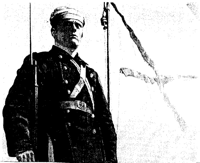
Г.Гурьянов "Балтийский флот"

Подчеркнуто оппозиционная Западу теория Новикова - это националистическое переосмысление истории искусства России и попытка противостоять культурному вторжению западного модернизма. "Я эколог, - говорит он, - для меня очень важно сохранить культуру, находящуюся на грани исчезновения." Новиков полагает, что модернизм - это помрачение ума, искажение, форма, инфантированная, по его мнению, "примитивными, африканскими шаманскими" ценностями. "То, как Запад смотрит на будущее, не представляет для нас абсолютно никакого интереса, - говорит он. - Каким западный человек видит будущее? - дрянные дешевые фильмы. А в сфере искусства - модернизм - пустота, беспорядочность и уродливость." Русский футуризм 10-20-х гг. (единственный период, который на Западе считается действительно ценным) Новиков и его коллеги расценивают как кривую дорожку, модернистское отклонение от истинного пути