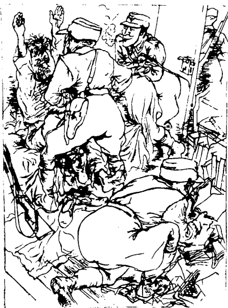
Г. Гросс "Писатель, это ты?" 1935г.

Фашизм и философия, фашизм и культура - что может соединять эти противоположные пары понятий, как не полная и абсолютная несовместимость: присутствие одного должно означать отсутствие условий существования другого. Хотя Мераб Мамардашвили в таком случае говорил об "отрицательном условии философии" - прежде чем