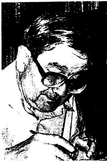
Доктор филологических наук Я.С.Лурье - известный историк и литературовед, видный специалист в области древнерусской литературы, автор многих книг и статей.

Составлено на основе статей Я.С.Лурье "Национализм и русская историография XX века" 1) и "Древняя Русь в сочинениях Л.Н.Гумилева" 2)