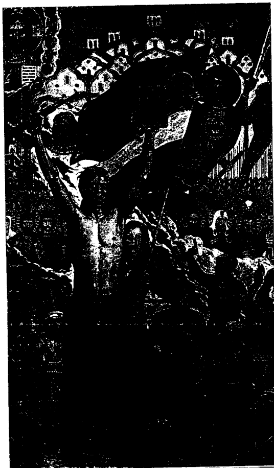
И.Глазунов "Проснись, Россия!"

Его газета "Лимонка" извергает поток ненависти по отношению к ингушам, чеченцам, выдвигает странноватые теории о том, что Китай, перенаселенный мужчинами, якобы намеревается совершить вторжение в Россию, чтобы воспользоваться русскими женщинами. Несколькими лет назад Национал-большевистская партия объединилась с группой музыкантов, дабы способствовать распространению своих идей. Среди этих музыкантов были ныне умерший Сергей Курехин, рок-группа "Коррозия металла" и сибирская панк-группа "Гражданская оборона". "Мы - современная партия, - говорит Лимонов, - молодая партия заинтересована в молодых людях. Артисты могут нам помочь привлечь этих людей. Неоклассицизм завоевывает страну. Мы чувствуем себя здесь, как после падения Римской империи."