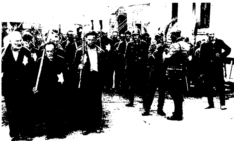
Из документов выставки: Могилев, 1941

публично, и “нами” - “а разве нас спрашивали?”. Все это, впрочем, касается лишь тех, кто вообще негативно оценивал случившееся в Германии в 30-х - 40-х годах и испытывал горечь и стыд, а не сожаление о поражении нацистского режима. Ведь были и такие, есть они и сейчас, и их немало - а мало ли у нас людей, горько оплакивающих “прекрасную” сталинскую эпоху?