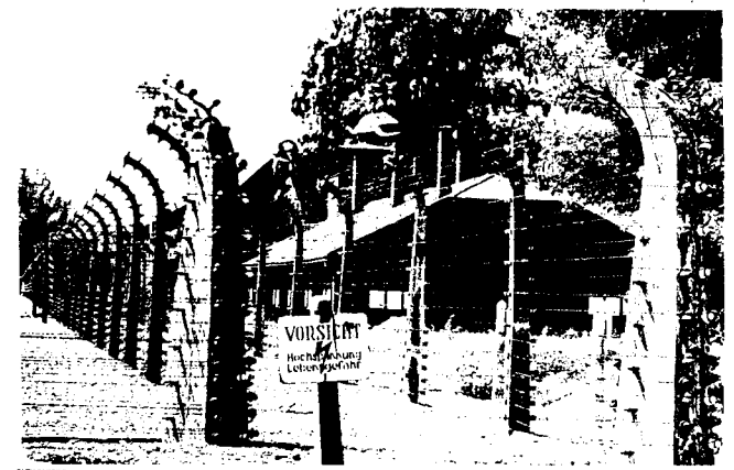
Лагерь смерти Освенцим