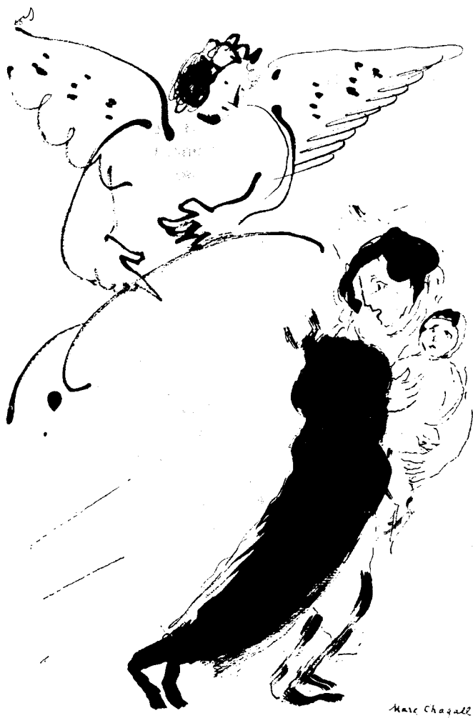
Рождество (рисунок для журнала «Вог»). 1943

Нераскрытое преступление страшно тем, что приходится ждать повторения. Говорят, что в этой войне нет победителей. Но как мы можем утверждать, что преступники не достигли своей цели, когда мы даже не знаем, в чем заключалась эта цель? Ясно лишь, что все слишком дорого заплатили за это. Нам решать, захотим ли мы платить снова.