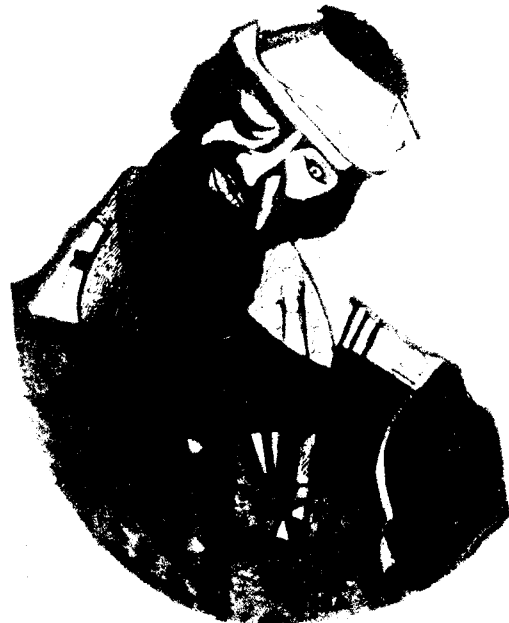
М.Шагал Раненый солдат 1914

Не имея возможности опубликовать полностью материалы о пытках в армии, подготовленные "Солдатскими матерями Санкт Петербурга", мы предлагаем всем, кого может интересовать дополнительная информация обращаться в организацию по адресу Измайловский пр., д.8, ком.16 или в редакцию "ТУМ балалайки".