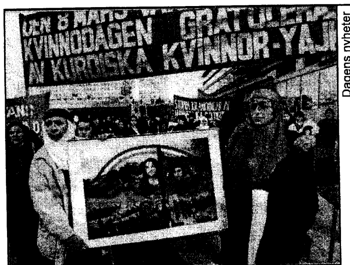
Курдские женщины на демонстрации в Стокгольме 8 марта 1997 г.