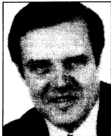
Министр обороны Германии Фолькер Рюэ

Однако здесь министр столкнулся с немецким пониманием правовой защиты личных данных. Ранее нацисты уже