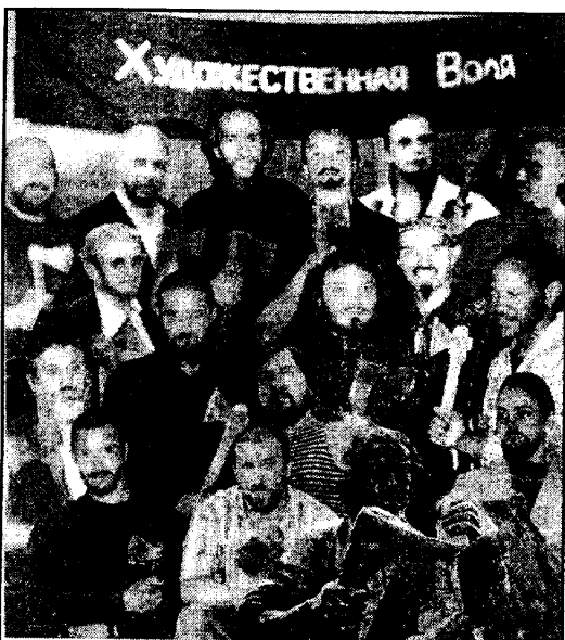
«Топор — не орудие убийства, а инструмент созидания»

Может быть, деградация «Лайбах» и «Нового Словенского Искусства» от издевки над тоталитаризмом к практической его пропаганде не была бы столь интересна и поучительна для нас, если бы практически то же самое не происходило в России. Речь идет о «Новой Академии Изыщных Искусств» Тимура Новикова на Пушкинской, 10 (уже рассматривавшейся однажды в нашей газете). Все, начиная от названия и кончая уклоном вправо, как две капли воды схоже с люблянским движением. Нельзя утверждать, что одни подражали другим — скорее, во всех постсоветских государствах начали проявляться одни и те же тенденции. Тоже в конце восьмидесятых, тоже молодые талантливые художники, только что вылезшие из андерграунда, находясь в котором они составляли оппозицию официальному искусству, почувствовали необходимость объединения вокруг какой-либо новой идеи. Этой новой идеей стал так называемый «неоклассицизм», давать которому определение представляется задачей скорее искусствоведа, чем антифашиста. Интерес представляет для нас именно идейность