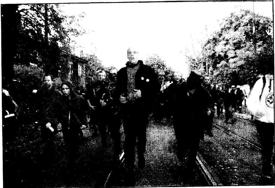
Акция 18 октября 1997 г.

АФА – антиавторитарная организация. Наша структура базируется на принципах: власть – общему собранию, прямые действия, сопротивление лидерам. В соответствии с нашими революционными взглядами мы не можем со-