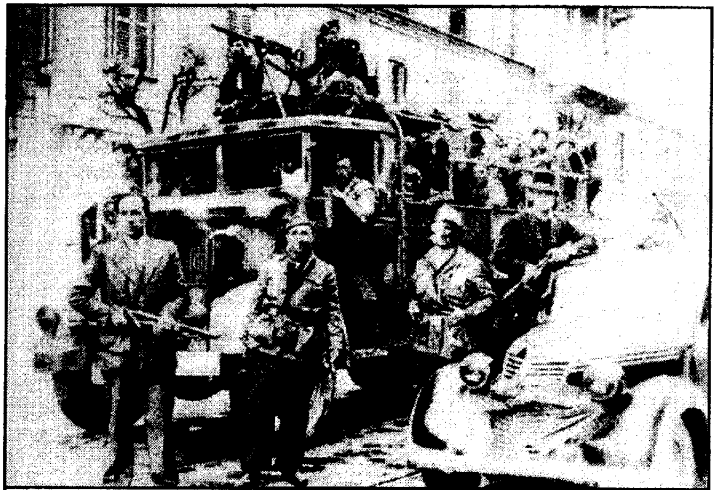
Партизанский патруль на улицах Турина. Апрель 1945 г.

Отношения между заключенными-коммунистами и анархистами всегда были напряженными, так как первые, связанные политическими директивами партии и Москвы, всегда делали