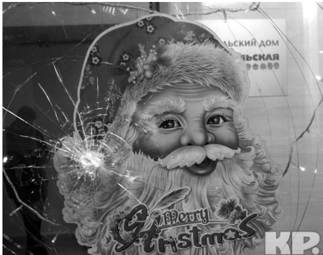
Следы нападения на офис «Комсомольской правды».