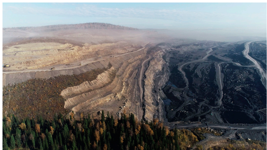
Разрез «Кийзасский».

Хакасы, шорцы и телеуты — коренные жители Южной Сибири. Земли, на которых они живут и занимают традиционными видами хозяйства, богаты углем, из-за чего их территории стали в последнее десятилетие интенсивно разрабатываться угольными компаниями. Уголь здесь добывают открытым, то есть самым дешевым и при этом самым грязным способом. Коренные общины страдают от загрязнения окружающей среды, сталкиваются с незаконным изъятием земель, непоправимый вред наносится традиционной среде обитания коренных народов, разрушаются их культурные и религиозные объекты, а активисты, экологи и защитники прав коренных народов подвергаются преследованиям.