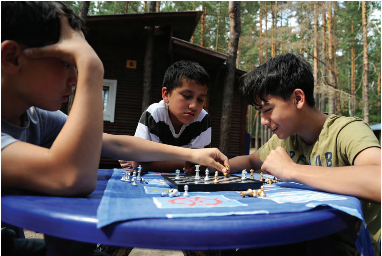
Ребята играют в шахматы